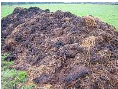
Fumier "fait", compostage seul efficace

Si le fumier est très pailleux, il faudra soit l'arroser ou/et le mélanger à d'autres matières plus fermentescibles (tonte de gazon, lisier, ...) avant compostage afin d'obtenir le taux C/N et l'humidité