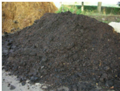
Compost mûr, fumier de cheval