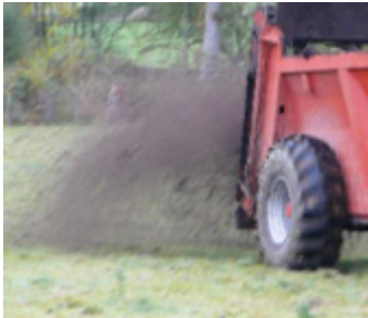
Épandage à l'automne