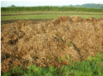
Fumier pailleux, compostage seul difficile

Le fumier de cheval seul est approprié à la technique de compostage s'il est suffisamment pourvu en matières fécales (fumier «fait», imbibé d'urine et de crottin).