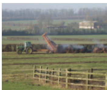
Mise en andains du fumier au champ après 2 mois de stockage en fumière (en fin d'hiver)