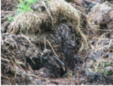
Fumier hétérogène

Les principaux amendements humifères épandables sur prairie sont le fumier et le compost de fumier. Les amendements à base de déjections animales ou végétales sont plus ou moins décomposés. Une analyse chimique en laboratoire (~30 à 50 €) est conseillée pour connaître la valeur agronomique du produit qui sera épandu.