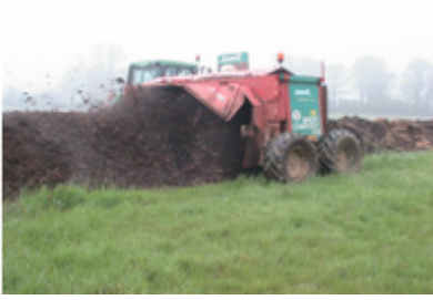
2 retournements du fumier par une composteuse (printemps)